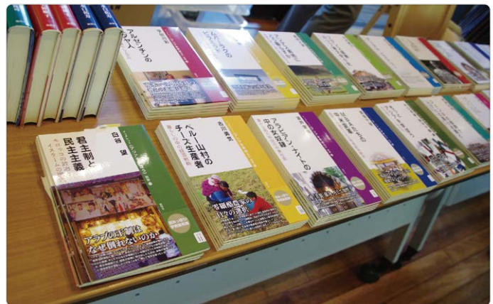
ブックレットとして出版