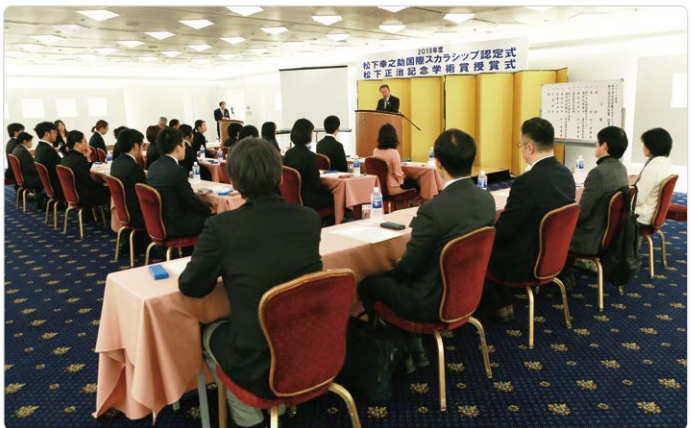
松方正治記念学術賞として出版